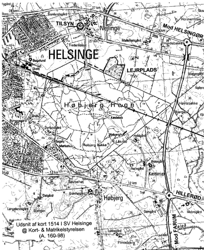
Udsnit af kort 1514 I SV Helsingør