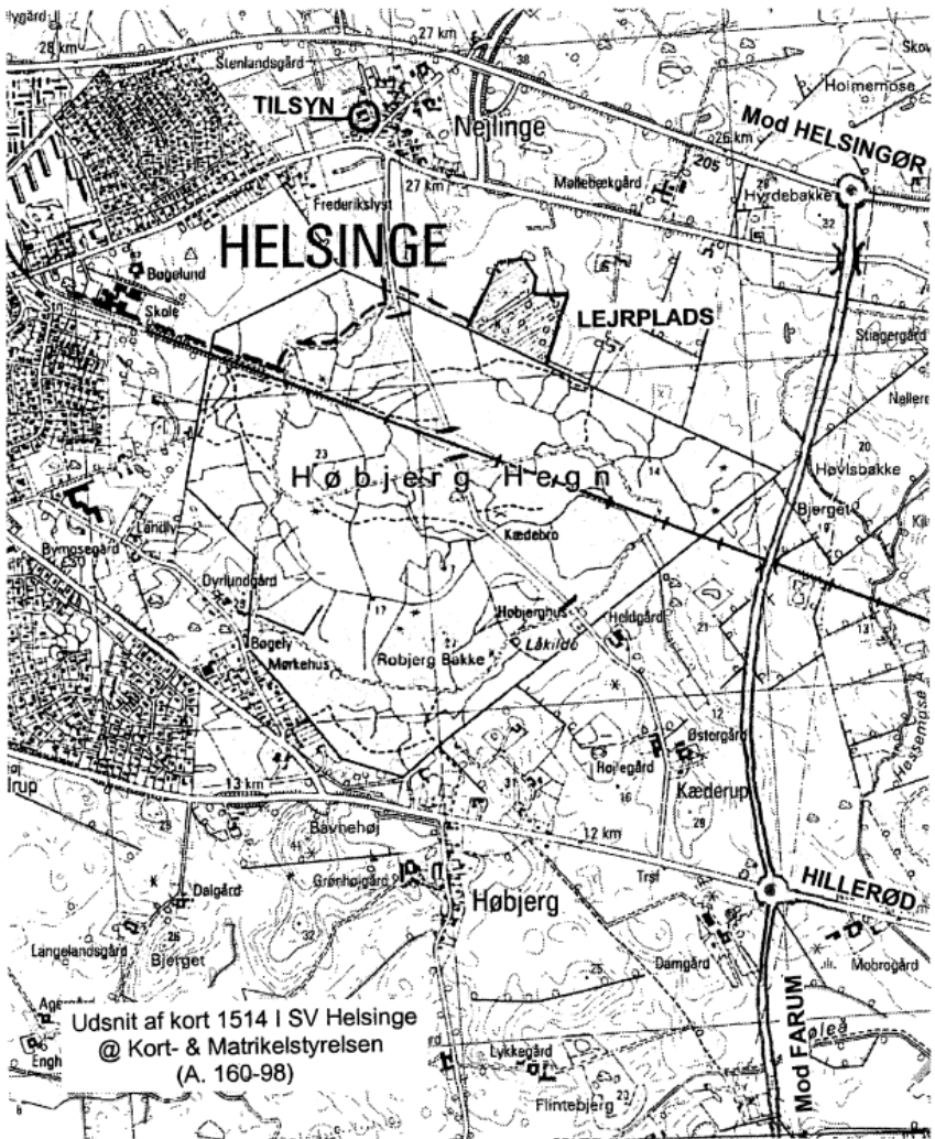
Udsnit af kort 1514 I SV Helsingør